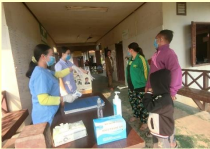
ຮູບພາບການນຳໃຊ້ອຸປະກອນການແພດເຂົ້າໃນວຽກງານ ຕົວຈິງຢູ່ໂຮງໝໍຊຸມຊົນ, ແຂວງຫຼວງນໍ້າທາ