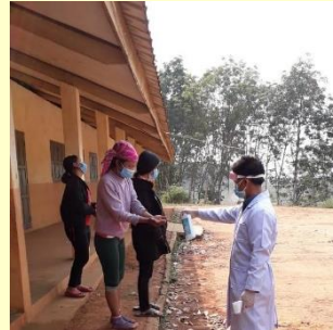
ຮູບພາບການນຳໃຊ້ເຈວລ້າງມືເພື່ອປ້ອງກັນພະຍາດ COVID-19 ຢູ່ແຂວງຫຼວງນໍ້າທາ