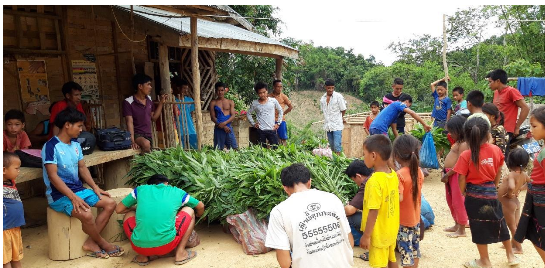
Figure 4 : distribution de plants de Cardamone

Il faut se rappeler que le bureau de Vientiane participe aux activités des projets. Les dépenses indiquées comme étant celles du bureau de Vientiane sont en partie des dépenses relatives à des activités des projets menées par les personnels du bureau.