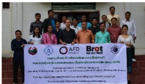
Figure 1 : Groupe de travail sur la gestion des ressources naturelles et la biodiversité

Le projet de la phase 2 à Oudomxay a pu être lancé grâce au financement de BdW et suivi par le financement de l'AFD.